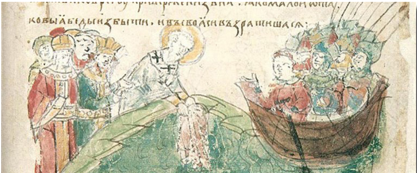
Св. Патр. Фотій та імператор Михаїл опускають в море ризу Влахернської ікони Божої Матері під час облоги Константинополя військами Аскольда Київського. Радзивилівський літопис

З давніх-давен для українців свято осіннього обрядового циклу — Покрова Пресвятої Богородиці було чи не найшанованішим святом, із ним пов'язано дуже багато народних прикмет, випробуваних і перевірених часом, а також звичаїв, що збереглися й досі.