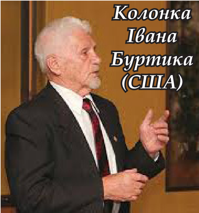
Колонка Івана Буртика (США)

Перед вами стоїть небуденне важне питання - вибори, від яких залежатиме ваше майбутнє та доля народу й нації. Чому вони будуть так важливі? Бо агресивний сусід, буде уживсти всіх йому доступних засобів, якщо тимчасово не збройним, то брехливо-пропагандивним способом осягнути його ворожих плянів. Майте на увазі, що в Україні аж кишить від сили 5-ої колони, яка у цих виборах буде намагатись задовільнити бажання свого сусіднього спонзора.