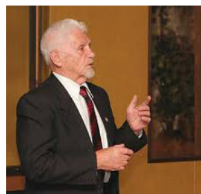
Колонка Івана Буртика Нью-Джерзі, США

Тому Україні час зрозуміти своє невідрадне становище. Негайно, змобілізувати всі фінансові і людські ресурси в розбудові оборонної сили, яку зараз, тільки респекує світ. Купувати летальну зброю там, хто готовий продати. Новими високарними законами, зупинити корупцію, хабарництво та продажність і жорстко карати п'яту колону та своїх зрадників. Коли ворг пізнає нашу силу, то він не наважиться ступити на поріг нашого дому..