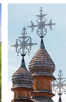
Figure 4. Left: cross-shaped Kozak grave marker from Zaporizhzhia; right: typical 17th-18th-century Ukrainian church crosses.

• This publication is a labour of love by Wasyl Sydorenko. All materials are public domain. When reprinting, however, please give proper credit.