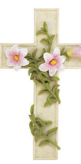
Figure 3. Left: garlanded cross of the Ukrainian Orthodox Church of Canada; right: garlanded Catholic or Protestant cross.