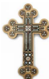
Figure 2. Left: Russian triple-barred Golgotha (Calvary) cross; right: budding Greek Apostles' cross.