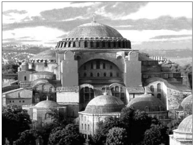
Свята Софія Константинопольська.

У Київській Русі, з прийняттям святого православ'я від Константинополя у 988-му році у храмах, монастирях і у Києво-Печерській Лаврі був розповсюджений устав Великої Церкви, тобто Святої Софії Константинопольської.