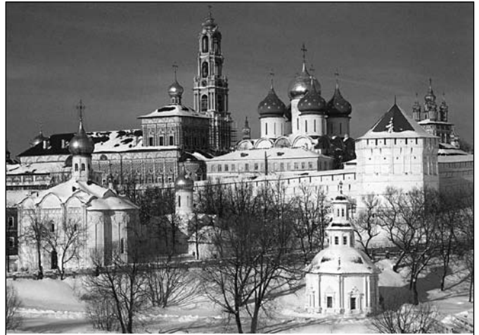
Свято-Троїце-Сергієва Лавра у м. Загорську (нині м. Сергієв-Посад).

Але ті ж самі уповноважені у справах релігій по Московській області не дозволяли Ректору, Архієпископу Володимирі приймати абітурієнтів з вищою державною освітою. Тому, Владика Володимир домовився з єпископом Смоленським і В'яземським Феодосієм (Процюком), щоб мене рукопокласти в сан диякона і священника з тим, щоб я зміг поступити на навчання. Два роки я відбудовував полурозбитий Свято-Миколаївський храм в селі Микола-Ярвня Смоленської області (17 км. від Смоленська).