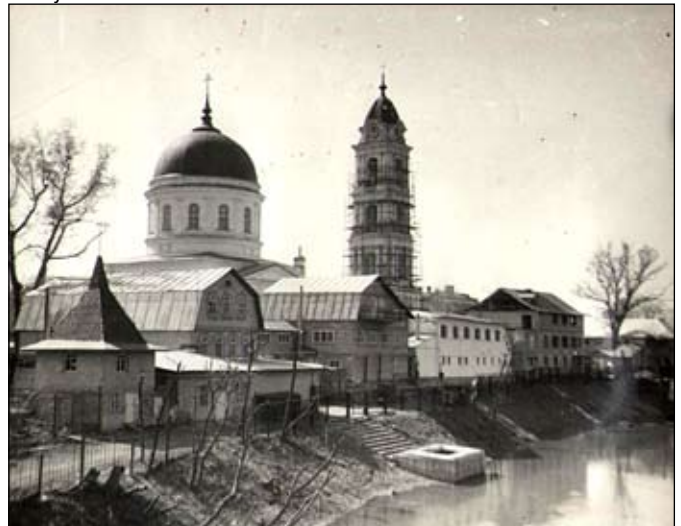
Богоявленський собор у м. Ногінську Московської області з комплексом будівель.

Але з Божою допомогою мені вдалося не тільки відновити Богоявленський собор, але й побудувати комплекс з десяяти 2-х і 3-х поверхових будівель. За два роки ми встигли стільки зробити, що 23-го липня 1991-го року, під час перенесення святих мощей преп. Серафима Саровського із Москви в Дівеєво, у Ногінську була перша зупинка.