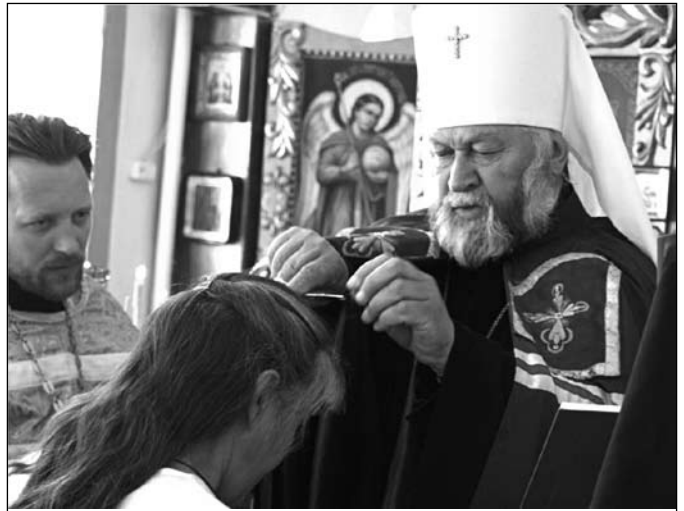
Митрополит Адриан звершує чин чернечого постригу над послушницею Іраїдою.

Треба кожному ченцеві й керівникам монастирів всю свою фізичну силу і енергію направляти також на фізичну працю, щоб в голову не йшли ніякі спокуси і гріхопадіння. Бо плоть і кров не наслідують Царства Божого, оскільки спокуси йдуть від гарячої крові, які призводять православну людину до великих помилок, особливо керівників, як Церкви, так і Держави.