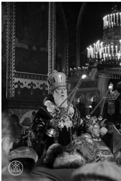
Початок на 1 стор.

Чи можна, захищаючи свою землю, вбивати, позбавляти життя? Це така дилема, що не кожна людина може розібратися в цьому. Як же християнин, який повинен виконувати всі заповіді, в тому числі й заповідь: не вбивай, захищаючи свою землю, повинен вбивати? Чи є це вбивством? Ні, браття і сестри, це не є вбивство. І це не є порушенням Заповіді Божої. Чому?