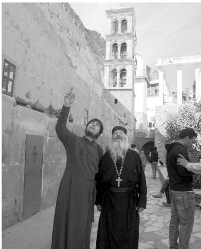
Початок на 13 стор.

Не існує в світі зброї грізнішої, як справжня любов! Це наш час! Сама історія вимагає сьогодні від кожного з нас надзвичайно важкого і незбагнено прекрасного подвигу: дивлячись в очі смерті, безкомпромісно любити! Тільки любов здатна на перемогу!