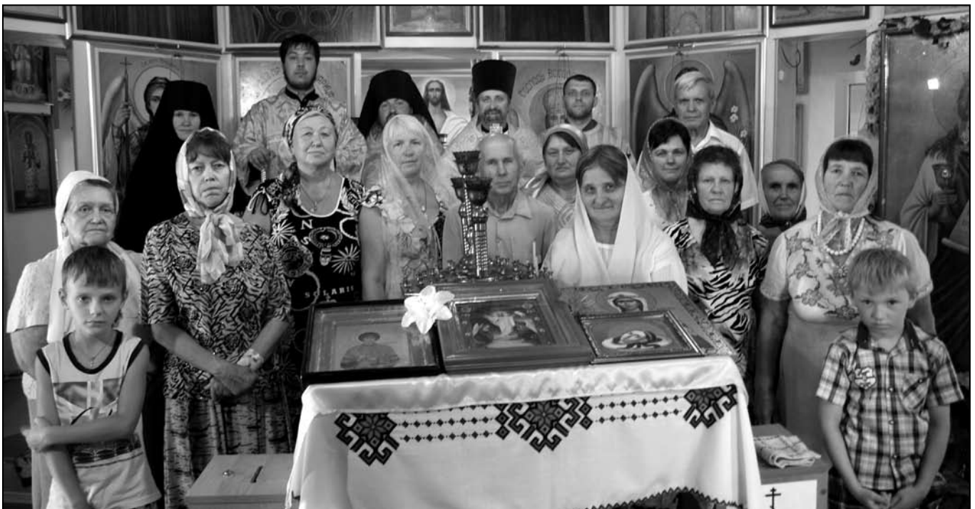
Загальне фото після Божественної літургії у Свято-Георгіївсько-Варваринському домовому храмі 30-го червня 2013-го року. Делегати від Богородської єпархії та парафіяни зі своїм священнослужителем.

30-го червня, у неділю гості молилися у Свято-Георгіївсько-Варваринському домовому храмі Митрополита Адріана, який розташований майже під одним дахом з його оселею.