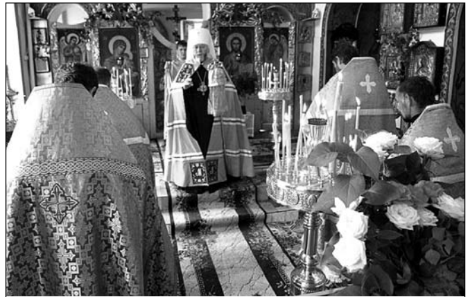
Благословення після Вхідних молитов

Це видиме явлення Бога-Духа Святого у день П'ятидесятниці та в день Хрещення Господнього святим апостолам та іншим свідкам древнього юдейського світу було пронесене ними й показане всьому світові, особливо в Єрусалимі того часу. Це було те явлення серед обраних Богом людей, яке не обирало кращих серед них, а закликала всіх присутніх, незалежно хто вони були