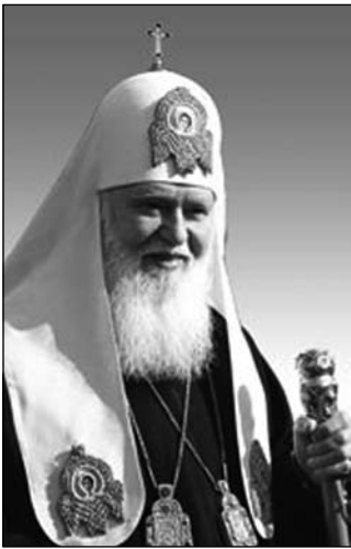
ФІЛАРЕТ, Патріарх Київський і всієї Русі-України

ПОСЛАННЯ Помісного Собору Української Православної Церкви Київського Патріархату (27 червня 2013 року)