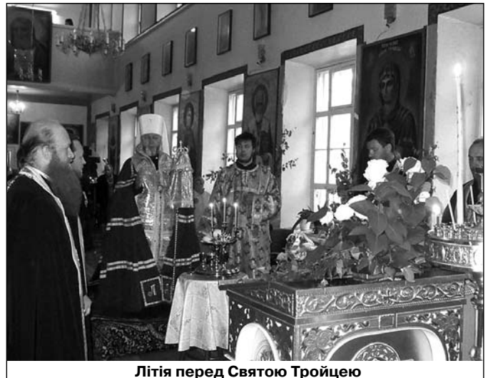
Літія перед Святою Трійцею

тали 17-ту кафізму, а потім канон з заспівами, присвячений всім отцям і матерям, братам і сестрам та всім православним християнам від віку спочилих, де читалися вголос записочки з іменами за упокій рідних і близьких, оскільки спочили наші брати і сестри у