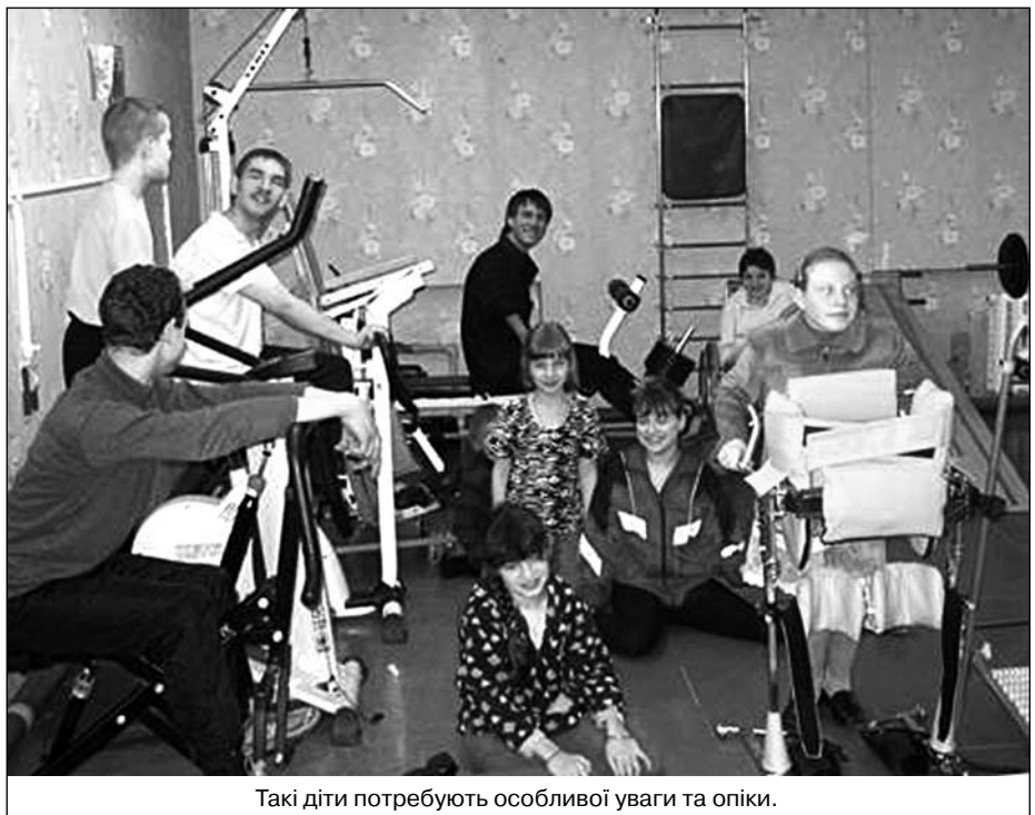
Такі діти потребують особливої уваги та опіки.