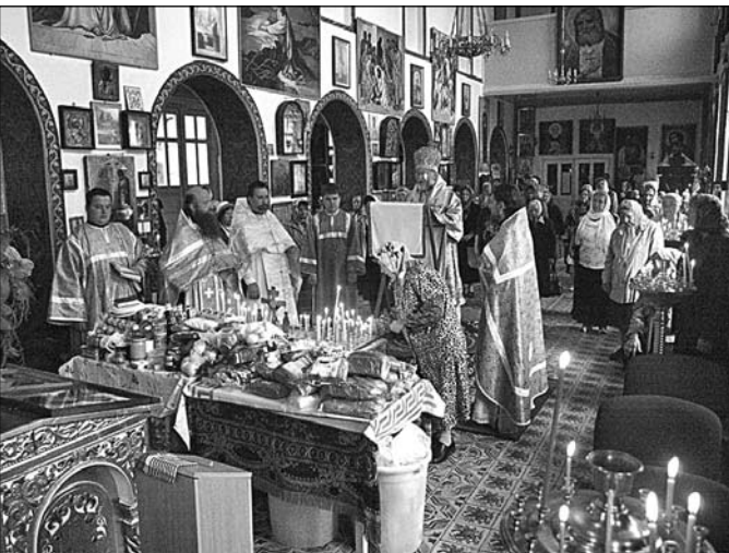
Всенічне заупокійне бдіння під Поминальну Трійцьку Суботу

Митрополит Адріан постійно звершував богослужіння та проповідував Слово Боже з Євангельського віровчення, з житія святих, історії Церкви Христової та про догматичні істини у великі свята на честь Вознесіння Господнього і в дні Святої Трійці.