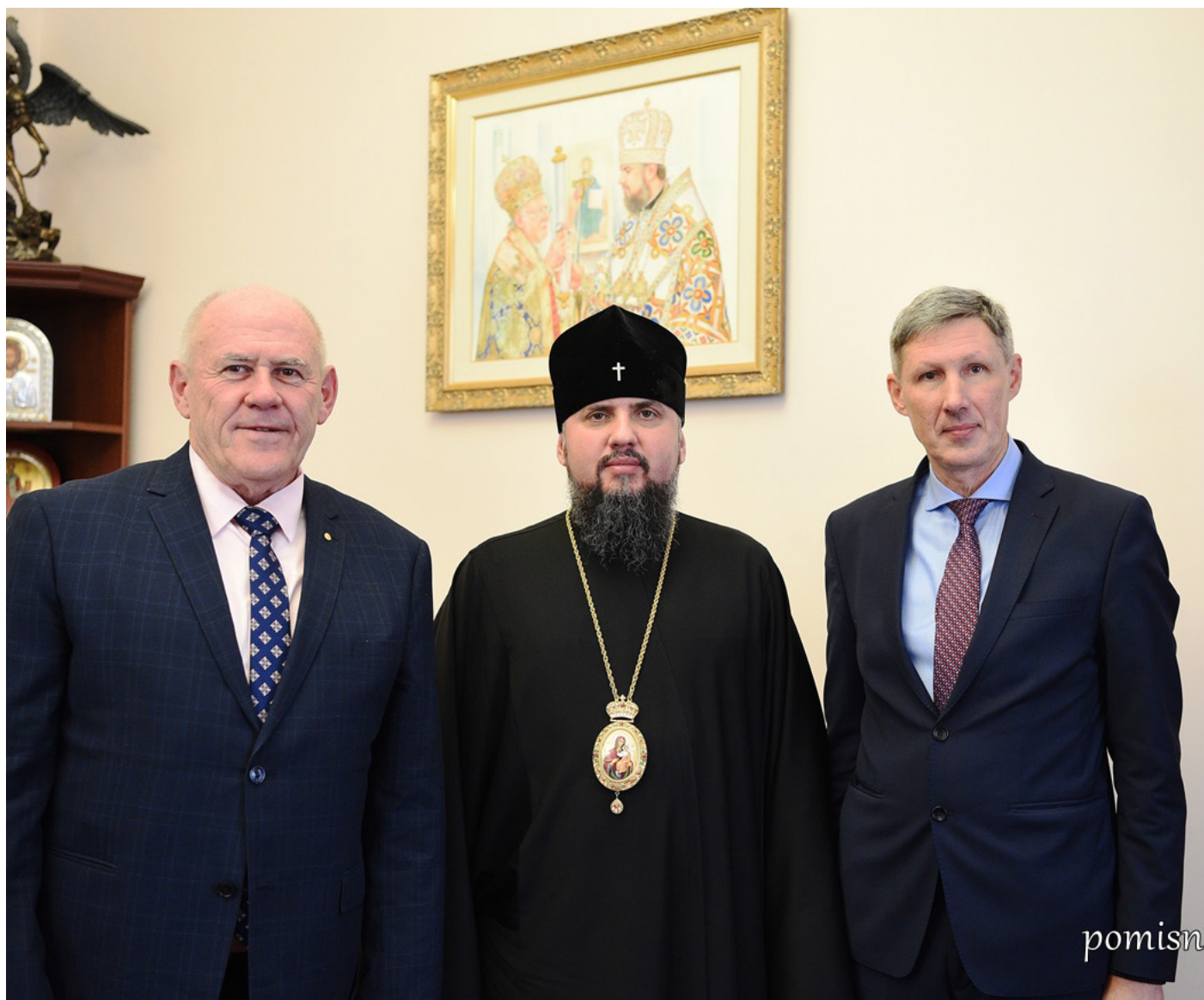
Прес-служба Київської Митрополії Української Православної Церкви (ПЦУ)

Окрім того, мова йшла про спорудження другої черги діючого Національного музею «Меморіал жертв Голодомору» і його майбутнє функціонування.