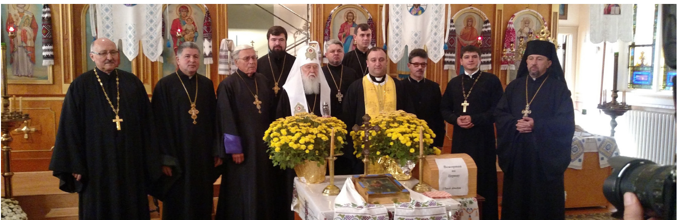
Світлина на згадку учасників конференції Настоятелів і Голів Громад Київського Патріархату в США