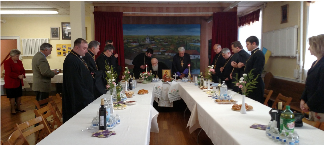
Конференція Настоятелів і Голів Громад Київського Патріархату в США

Текст і світлини Петро Палюх, член парафії Покрови Пресвятої Богородиці (Нью-Джерсі, США)