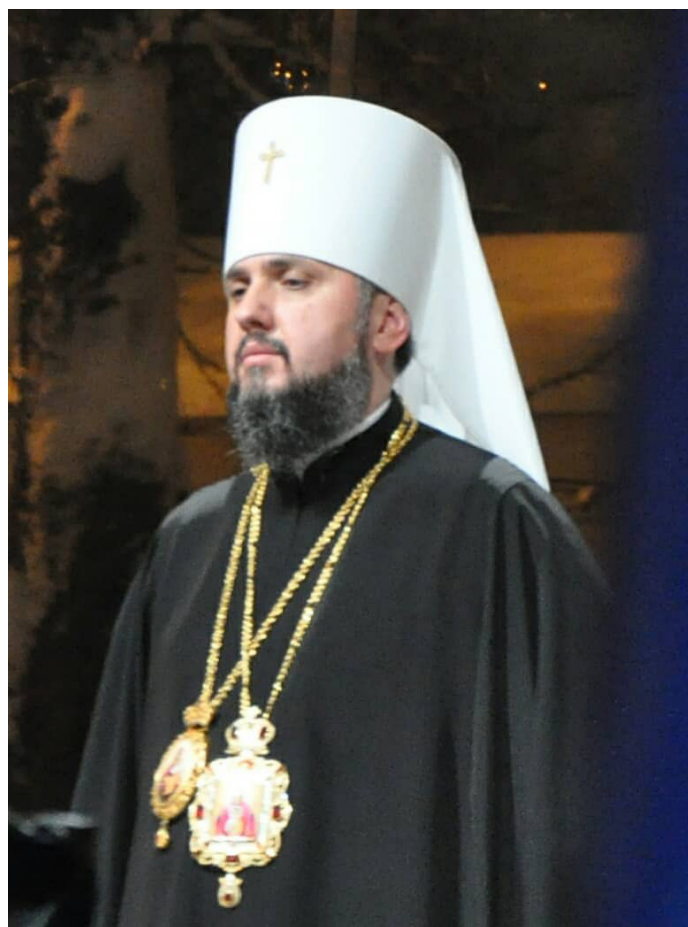
Прес-служба Київської Митрополії Української Православної Церкви (ПЦУ)

Причому, у всіх регіонах Православна Церква України має найвищі показники ставлення; зокрема, у всіх регіонах не менше половини населення позитивно ставляться до Православної Церкви України (від 50% на Сході до 69,6% на Заході; баланс ставлення варіює від +43,4% на Сході до +67,9% на Заході). Далі за цим показником іде Українська