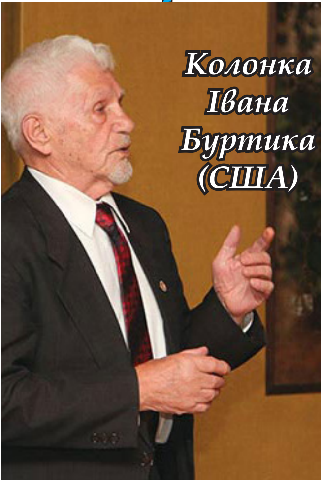
Колонка Івана Буртика (США)

Завдяки Конгресових публичних слухань демократичних оскаржувань Американського республіканського Президента Дональда Трампа, деякі народи, мабуть в перше почули про Україну, яка стала центром уваги. А для України ці слухання мають подвійні, як позитивні так і негативні значення. Позитивними можна вважати, що Президент Зеленський не дав ясної відповіді Трампові, що розглядатиме будь які проступки бывшего заступника Президента Америки Джо Байдена. Також, позитивом є і те, що Зеленський змовчав, коли Трамп заблюкував схвалену обома Палатами Америки 400 мільонову допомогу для України.