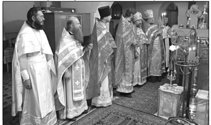
Правий фланг духовенства у вітварі під час Пасхальної Ранкової. На фото: Митрополит Адріан, 12-ть священників та 3 диякони.

С глубоким уважением к Вам - Митрополит Адріан