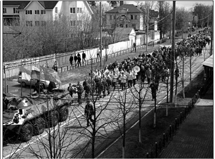
Урочистий парад адміністрації міста Ногінська та району, студентів, школярів, медиків, вчених, інтелігенції та всіх бажуючих, які йшли біля нашого Свято-Троїцького храму з живими квітами на центральний міський цвинтар для їх покладення на могили воїнів ВВВ.