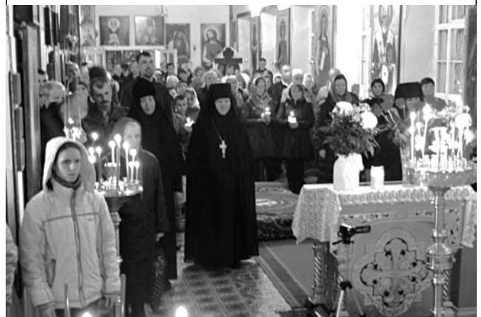
Парафіяни на нічному Пасхальному богослужінні.