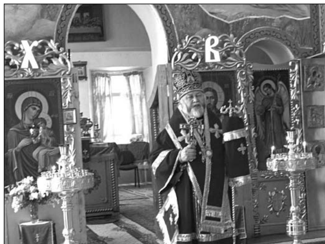
Проповідь Митрополита Андріана в день Святителя і Чудотворця Миколая.

http://www.eparhija.com.ua/index.php?newsid=307