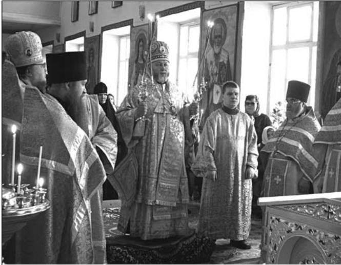
Малий вхід на Божественній літургії.

у храмі згадувались найважливіші події з Євангельської історії, які відбувались у цей день: Таємна вечеря, на якій було встановлене Таїнство Причастя, омивання ніг учням, молитва Господа в Гефсиманії та Юдина зрада. Саме в четвер у великих кафедральних соборах є традиція звершувати чин омивання ніг 12-ти священнослужителям. Під час омивання архієрей знімає з себе верхнє облачення та по черзі миє ноги дванадцяти священикам, обтираючи їх платом. Предстоятелі Православних Церков під час служби четверга освячують святе Миро. Варити його починають, зазвичай, ще з понеділка. Саме цю речовину згодом використовують священники під час звершення Таїнства Миропомазання.