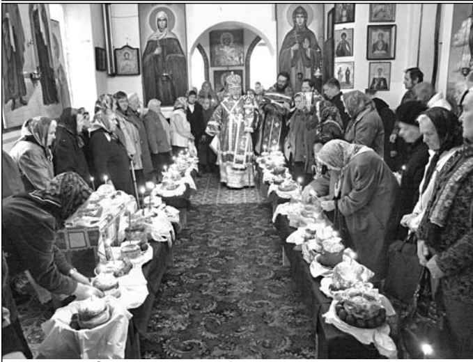
Освячення пасок та інших пасхальних яств.