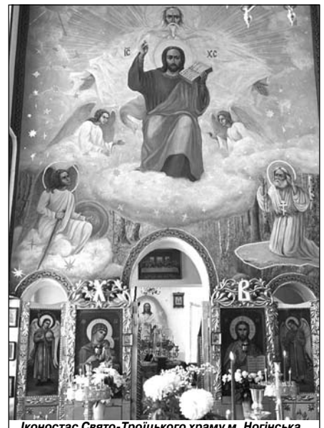
Іконостас Свято-Троїцького храму м. Ногінська.