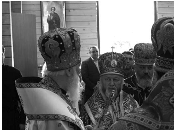
Проповідь Святійшого Патріарха Філарета.