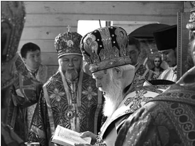
Святійший Патріарх Філарет очолив освячення Різдва-Богородичного храму м. Дніпропетровську на березі Дніпра.

Для цього треба вивчити життє про нього, знати його освіту, ввійти в стан його християнської душі і серця, побачити його святе і праведне життя, його благодійність і милосердя до бідних, нещасних, голодних, немічних, хворих, у в'язницях замучених, у морі потоплених, на плацях порубаних. Тому й ми багато святого й праведного в його особі відчуваємо і навчаємось. Але саме головне для сучасного духовенства, архієрейства та парафіан - є незламність святителя і чудотворця Миколая, його вольове слово і рішучі дії проти неправдивих, недостойних і брехливих людей в духовному сані направлених проти Правди Божої. Так, святитель Миколай поступив з Арієм, лжевчителем про Святу Трійцю і, особливо, про Христа Спасителя, як про другу іпостась Святої Трійці, про що угодник Божий виступив на I-му Вселенському Соборі у місті Нікеї (Мала Азія) з великою критикою і захистом Святої Православної Віри.