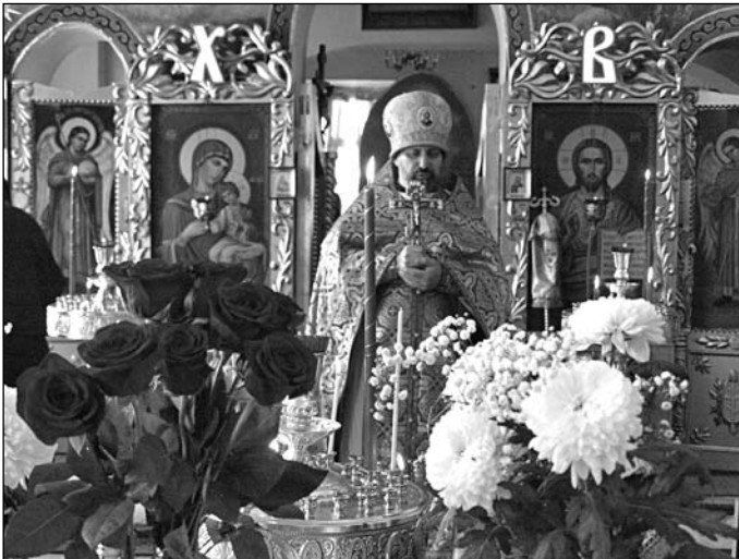
На свято святого Георгія Переможця (6 травня), клірик нашого храму, протоієрей Юрій Жиров (росіянин, медик-терапевт швидкої допомоги) відмічає свій день Ангела.