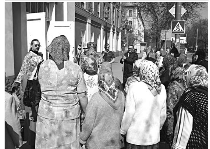
Завершення Хресного ходу у Світлу п'ятницю після Літургії.