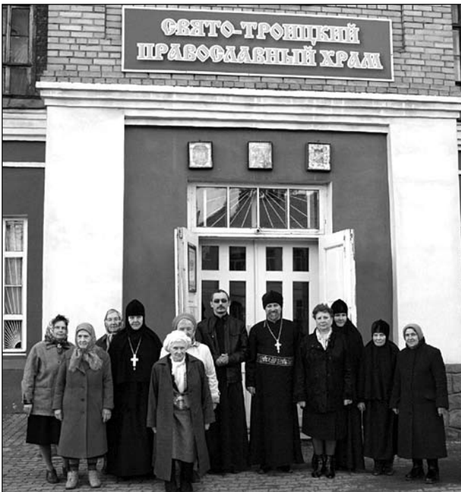
Духовенство і парафіяни Свято-Троїцького храму вітають демонстрантів параду на честь Дня Перемоги зі словами «Христос Воскрес».

Світла П'ятниця. Після Божественної літургії та Молебню відбувся Хресний хід навколо храму, після чого Митрополит Адріан виголосив своє архіпастирське слово.