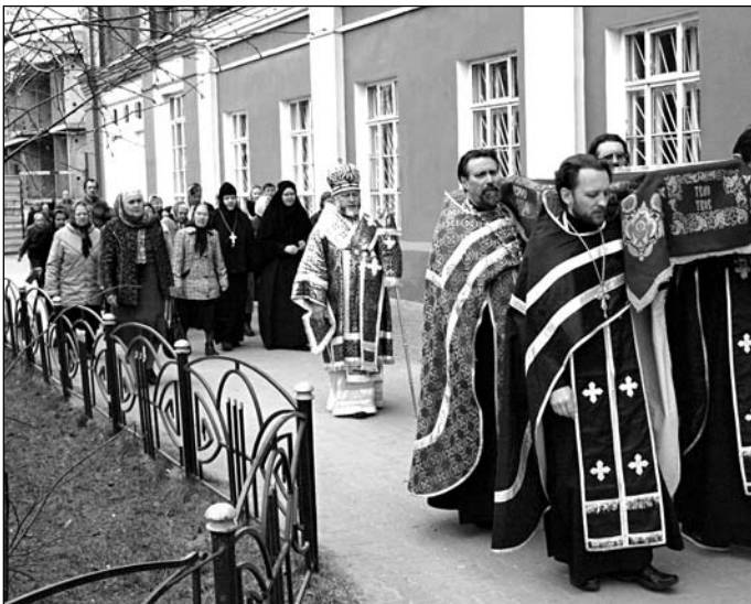
Обнесення Святої Плащаниці навколо храму після Великого Славослів'я на ранковій службі.

Це звершується при співі тропаря: «Благообразний Йосиф з древа зняв Пречисте Тіло Твоє...». Священнослужителі піднімають Плащаницю (тобто зображення Христа, що лежить у гробі) з Престолу, ніби з самої Голгофи і виносять її з вітаря на середину храму в супроводженні світильників і при кадіні.