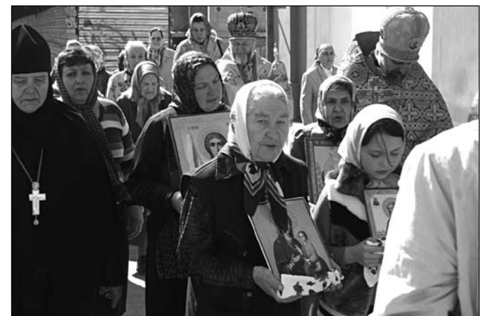
Хресний хід у Світлу п'ятницю після Літургії.