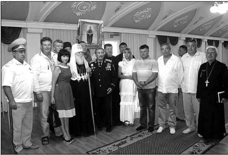
На зустрічі з Патріархом Філаретом.