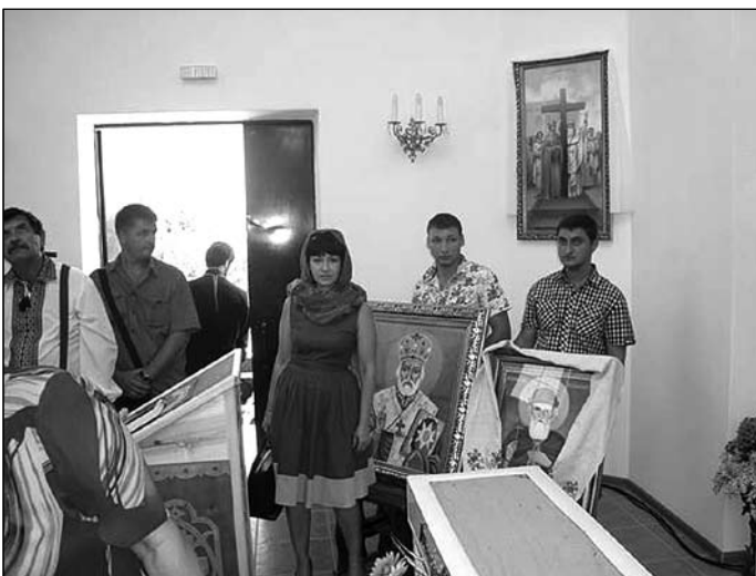
Перед початком літургії.