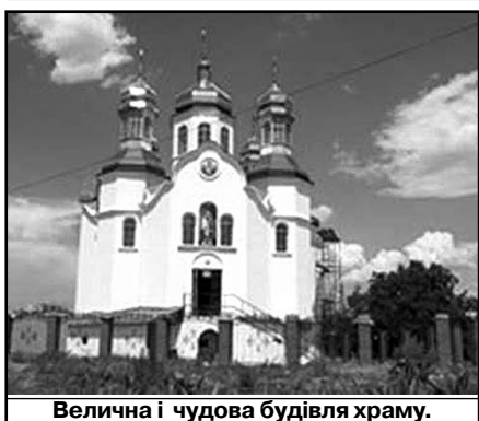
Велична і чудова будівля храму.

Зі святом 1025-ліття Хрещення Київської Русі-України!