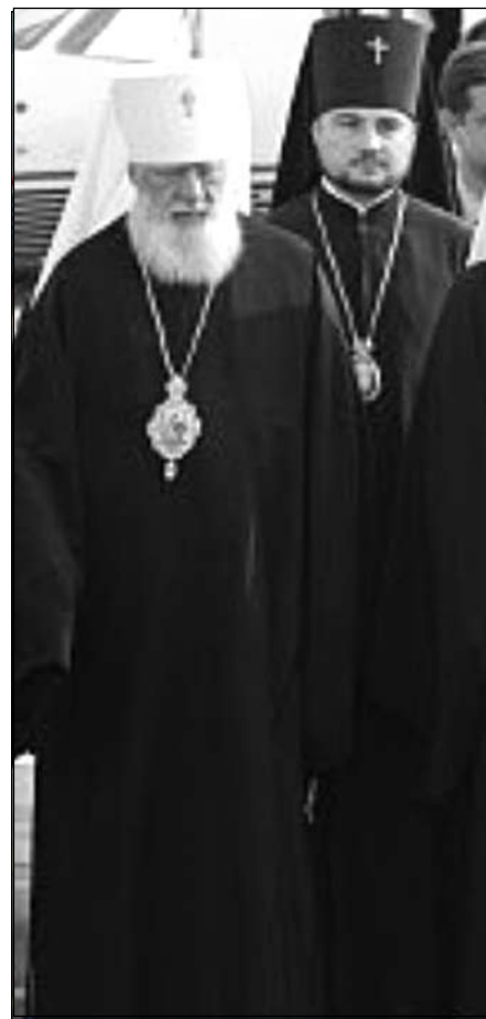
На фото: Митрополит Одеський Агафангел (Саввін) та Архієпископ Олександр (Драбинко).

Звичайно, що весь український народ мріє про об'єднання трьох Українських Православних Церков — УПЦ КП, УПЦ МП та УАПЦ — в єдину Помісну Церкву: