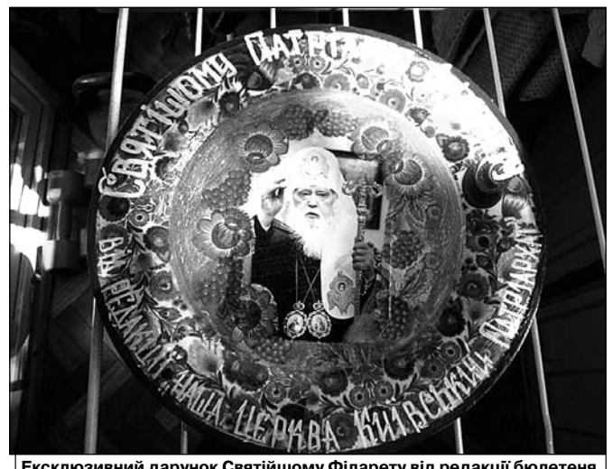
Ексклюзивний дарунок Святійшому Філарету від редакції бюлетеня «НЦ-КП» - петриківська тарілка із зображенням Патріарха.