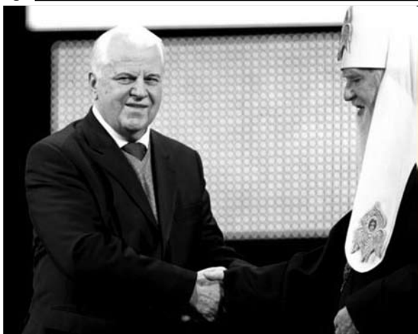
Президент України Л.М. Кравчук та Святійший Патріарх Філарет.