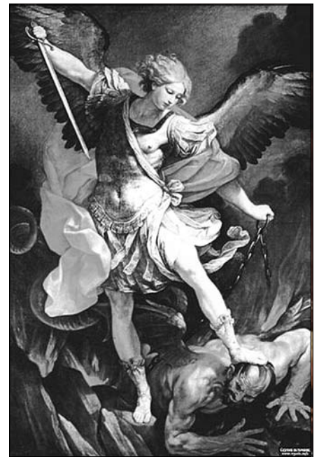
Архістратиг Божий Михаїл заковує диявола в кайдани.