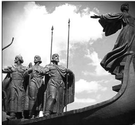
На фото: засновники міста Києва VI-го століття три брати і сестра: Кий, Щек, Хорив і сестра Либідь.

отримали свободу і незалежність завдяки своїй національній боротьбі, то тим більше український народ отримає цю можливість мати свою Помісну Українську Православну Церкву, оскільки саме вона є Матір'ю-Церквою для Російської Православної Церкви Московського Патріархату. Бо не