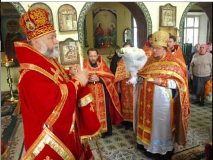
Благочинний Богородської єпархії УПЦ КП, прот. Євгеній Удалой вітає Митрополита Адріана.

Розміщуємо відеофільм про богослужіння Митрополита Адріана в день свята http://www.youtube.com/watch?v=WEDC4lpwu-I&feature=c4-overview&list=UUnt6PoFg8QkVgJmG5xTBqAA