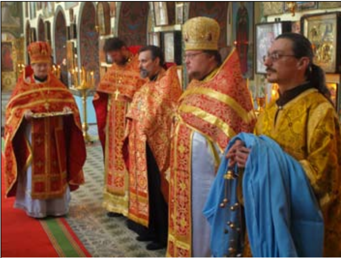
Зустріч Митрополита Адріана перед Божественною літургією.

ся в 2007-му році на чолі з Патріархом Московським Алексієм II (Рідігером) і Митрополитом Зарубіжної РПЦ - Митрополитом Лавром (Шкурло).