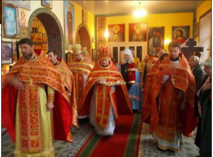
Митрополит Адріан і духовенство йдуть після зустрічі до головного вівтаря.

Після Божественної літургії та святкового Молебню відбулось вітання Митрополита Адріана з Днем його Ангела духовенством, чернецтвом та парафіянами. Потім він сказав своє архіпастирське слово, в якому зробив па-