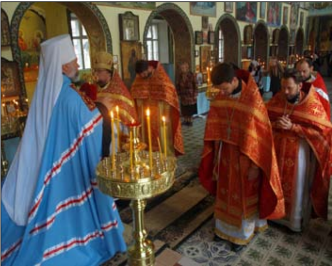
Благословення духовенства та парафіян.

Ми розуміємо, що між урядом України та Урядом Російської Федерації відбувалися і досі відбуваються якісь-то чисто людські непорозуміння один до одного, як на дипломатичному, так і на державному рівнях.