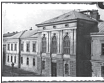
Табір військовополонених у Станіславі, 1944

швидкістю...коли потяг сповільнив швидкість я зіскочив з нього...Мені вдалося зіскочити найбільш удало. Проте, мене вкрив холодний піт, коли я побачив, що потяг все більше уповільнює швидкість. Хвилину пізніше я не чув взагалі вже цього холоду, бо