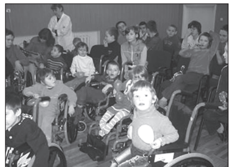
Такі діти потребують особливої уваги та опіки