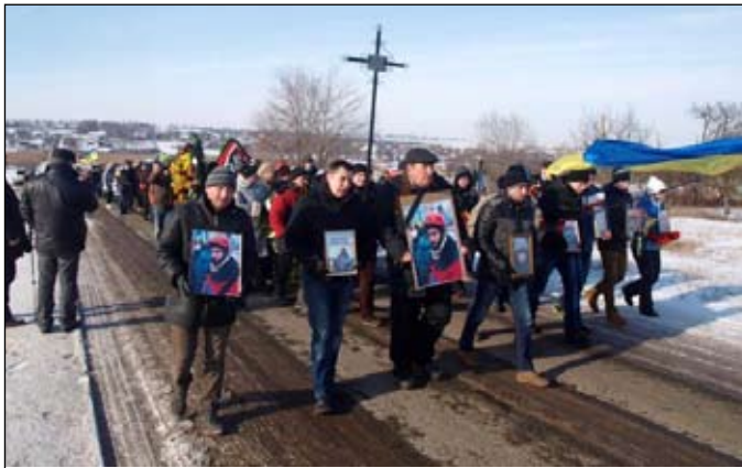
Похоронна процесія з українськими національними прапорами