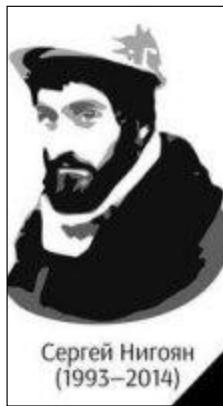
Сергей Нигоян (1993–2014)