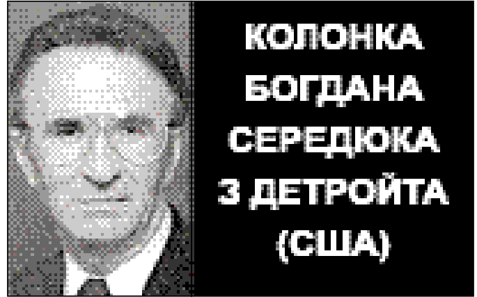
КОЛОНКА БОГДАНА СЕРЕДЮКА З ДЕТРОЙТА (США)

Ми знаємо усіх злочинців поіменно. Усі вони живуть поруч із нами і не уникають покарання. Ті, що виконували накази відповідатимуть так само, як і ті, хто їх віддавав.