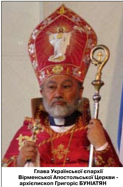
Глава Української єпархії Вірменської Апостольської Церкви - архієпископ Григоріс БУНІАТЯН

Ми також розміщуємо відеофільми багатьох відео сайтів, які розказують про похорони патріота України, вірмена за походженням, - Сергія Нігояна.