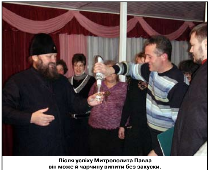
Після успіху Митрополита Павла він може й чарчину випити без закуски.

http://www.youtube.com/watch?v=HreNhSWz9pU&feature=c4-overview&list=UUnt6PoFg8QkVgJmG5xTBqAA