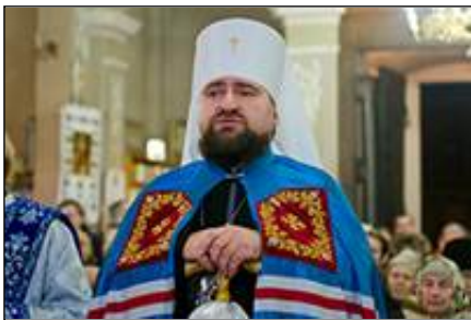
Всечесні отці! Дорогі брати і сестри!

Ми стоїмо перед яслами, які кожного року в ці дні знаходяться посеред храму, і бачимо перед собою втіленого Бога. Особисто для мене це дуже зворушливий період і я радію, що ми сьогодні, у цей 7-ий день 2014 року, зібралися тут, щоби прославити новонароджене Немовля Ісуса.