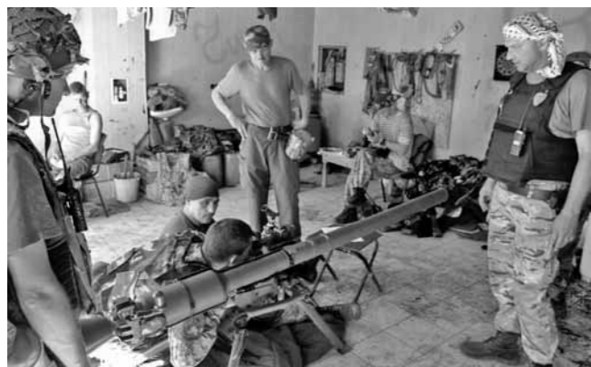
Inside the position 18 garage in Pisky, Ukraine

Shrapnel and bullet holes had shredded the exterior walls, leaving the yellow paint polka-dotted by the grey concrete underneath. The soldiers used the living room as a communal space to eat and sleep.