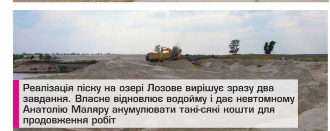
Реалізація піску на озері Лозове вирішує зразу два завдання. Власне відновлює водойму і дає невтомному Анатолію Малеяру акумулювати такі-сякі ношти для продовження робіт