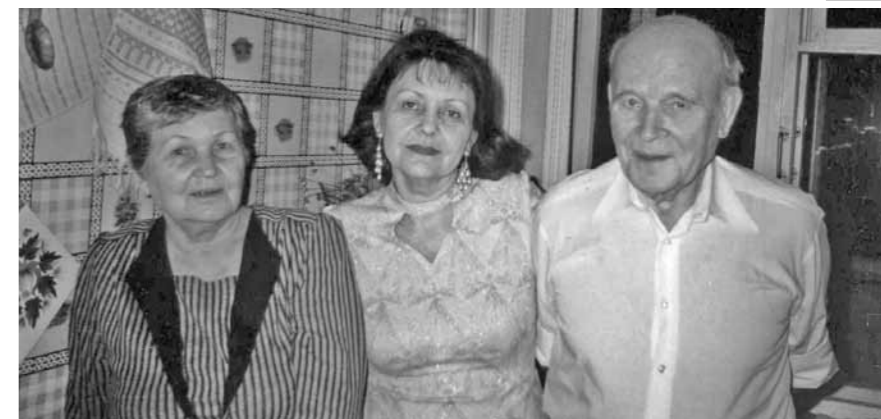
пані Олені не бути «знесеною» лавиною численних привітань та дружніх зустрічей. А ще – зібратися з силами, аби прямувати далі й далі – тер- нистим шляхом, що веде до височезних шпилів Мистецтва. Розмовляла Еліна Заржицька