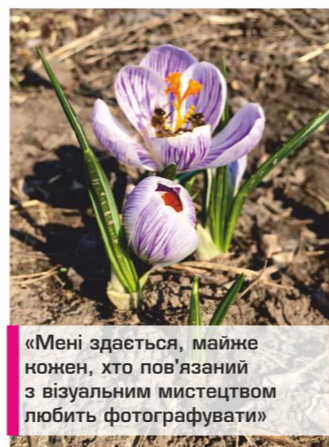
«Мені здається, майже кожен, хто пов'язаний з візуальним мистецтвом любить фотографувати»