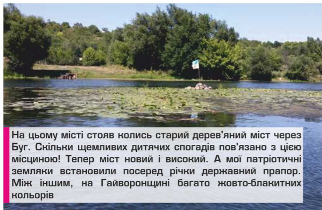
На цьому місті стояв колись старий дерев'яний міст через Буг. Скільки щемливих дитячих спогадів пов'язано з цією місциною! Тепер міст новий і високий. А мої патріотичні земляки встановили посеред річки державний прапор. Між іншим, на Гайворонщині багато жовто-блакитних нольорів