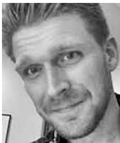
Nolan Peterson, a former special operations pilot and a combat veteran of Iraq and Afghanistan, is The Daily Signal's foreign correspondent based in Ukraine.