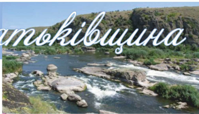
Південний Буг чи не єдина річка в Україні, де збереглися природні пороги. Скільки раз бував я на них хлопчиком! Нині шумлять вони не так вже грізно як колись. Може через те що хлопчик вже давно пузатий дядько...

Хата мого діда була в селі Буговому, що за 7 кілометрів від районного центру на правому березі такої милої серцю річки Південний Буг. Колись це поселення називалося Юзефпіль. Чому така назва і навіщо змінили її свого часу «більшовики-ленінці» пояснити мені ніхто не міг. Нині в Буговому мешкає яких три сотні людей. Здебільшого, як і скрізь по Україні, старики. Якоїсь, так би мовити, інфраструктури в селі фактично не має. Все найнеобхідніше в сусідній Хашуваті, що на протилежному боці річки. А сільрада у більш віддаленому селі Казавчин. Ось так живуть забуті не Богом, а владою буговчани. І сподіваючись лише на себе таки дають раду.