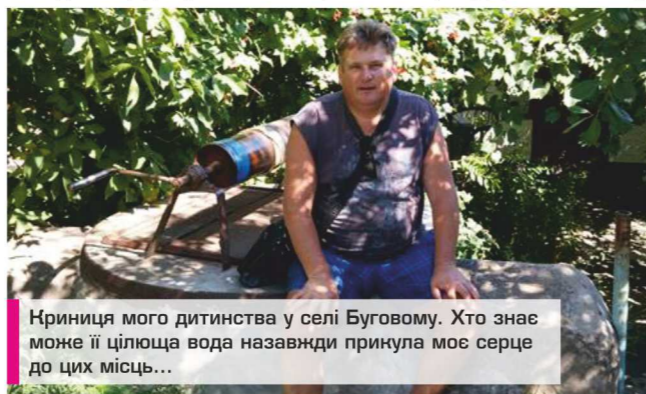
Криниця мого дитинства у селі Буговому. Хто знає може її цілюща вода назавжди прикула моє серце до цих місць...