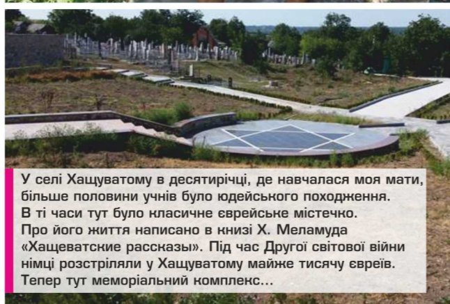
У селі Хашуватому в десятиріччі, де навчалася моя мати, більше половини учнів було юдейського походження. В ті часи тут було класичне єврейське містечко. Про його життя написано в книзі Х. Меламуда «Хашеватские рассказы». Під час Другої світової війни німці розстріляли у Хашуватому майже тисячу євреїв. Тепер тут меморіальний комплекс...