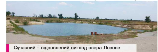
Сучасний – відновлений вигляд озера Лозове