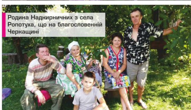
Родина Надкирничних з села Ропотуха, що на благословенній Черкащині