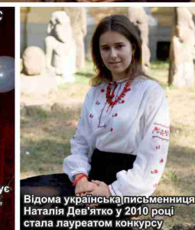
Відома українська письменниця Наталія Дев'ято у 2010 році стала лауреатом конкурсу