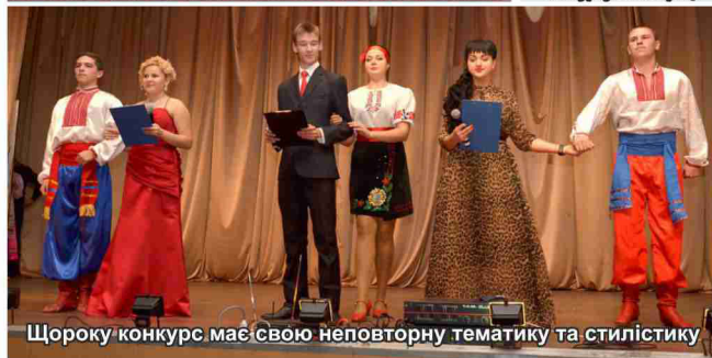
Щороку конкурс має свою неповторну тематику та стилістику