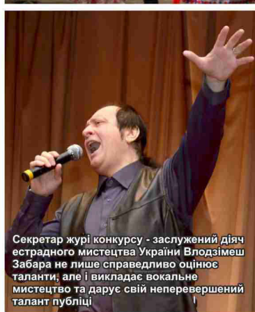
Секретар журі конкурсу - заслужений діяч естрадного мистецтва України Влодзімеш Забара не лише справедливо оцінює таланти, але і викладає вокальне мистецтво та дарує свій неперевершений талант публіці