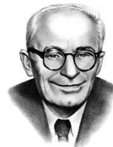
Остап Вишня (1889—1955)

Твори Остапа Вишні - народного митця і великого майстра сатири та гумору - здобули заслужене визнання мільйонів читачів.